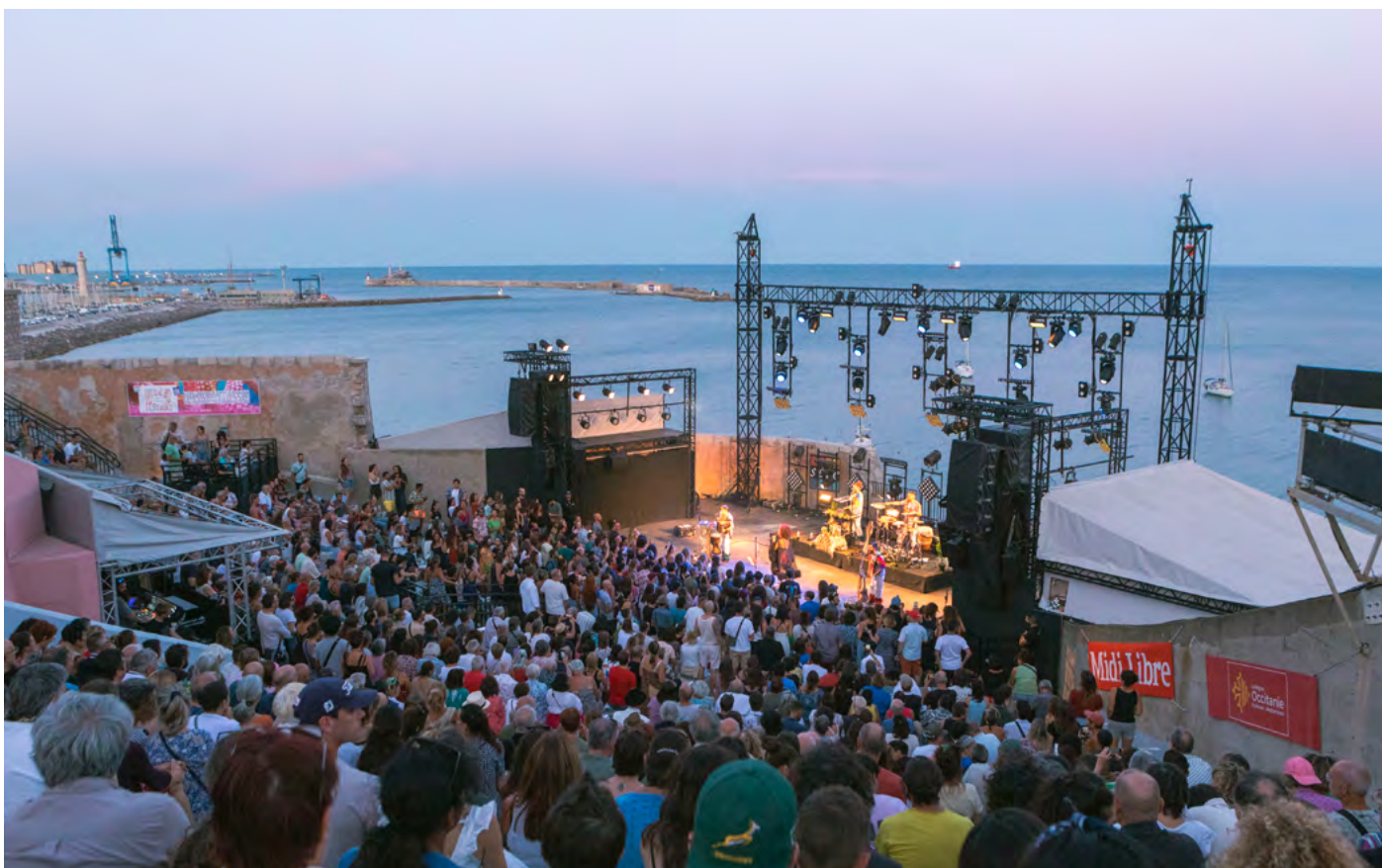
Théâtre de la Mer, Sète